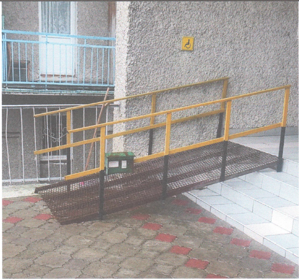
Фото 2 - Зовнішній пандус до гуртожитку академії за адресою: м. Кременець, вул. Словацького, 1а