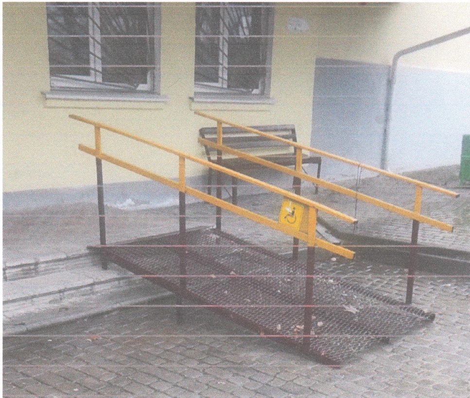
Фото 4 - Зовнішній пандус до спортивного залу академії за адресою: м. Кременець, вул. Ліцейна, 1