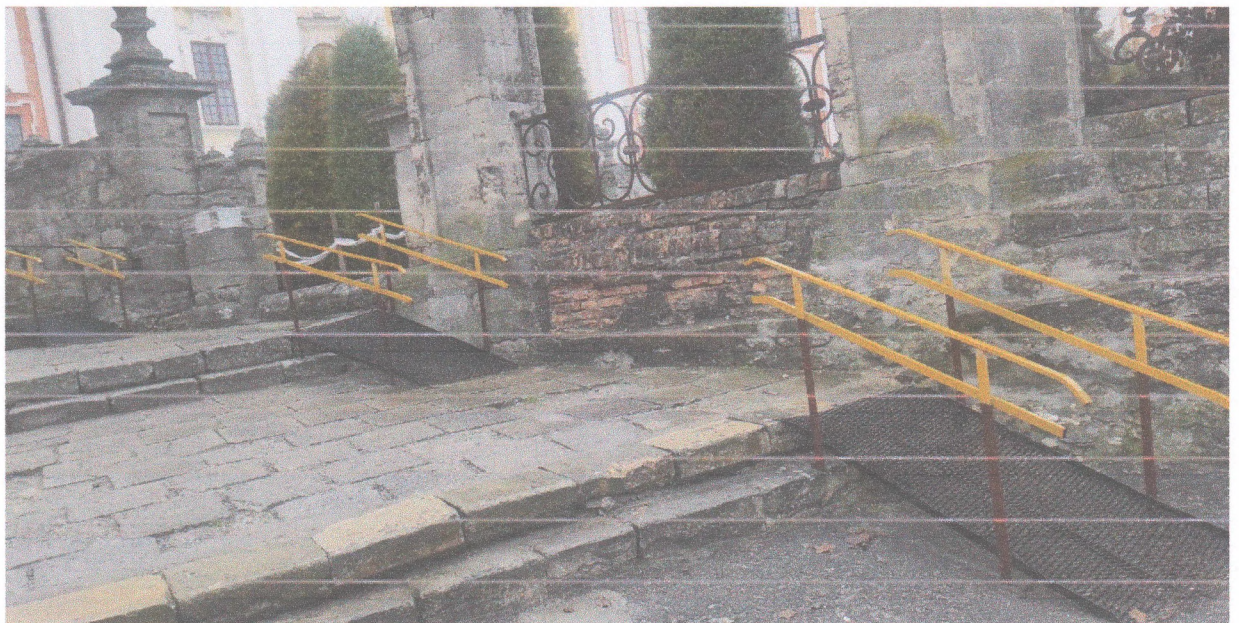
Фото 5 - Зовнішній пандус до північного та південного корпусів академії