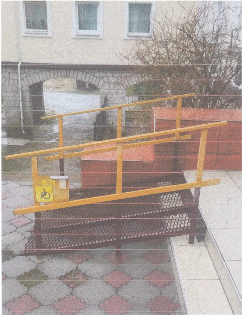
Фото 1 – Зовнішній пандус до адміністративного корпусу академії за адресою: м. Кременець, вул. Ліцейна, 1