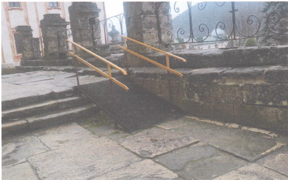
Фото 3 – Зовнішній пандус до північного та південного корпусів академії